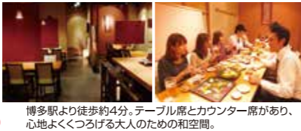
博多駅より徒歩約4分。テーブル席とカウンター席があり、心地よくくつろげる大人のための和空間。