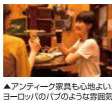
▲アンティーク家具も心地よい、ヨーロッパのパブのような雰囲気。