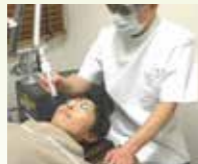
▲レーザートーンニング治療

左右対称にできるぼんやりとした褐色のシミ。くすんで見える要因になり、紫外線の影響で濃くなったりします。肝斑には、レーザートーンニングというレーザー治療が効果的です。