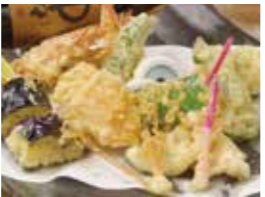
天ぷら盛り合わせ(1,250円) 丁寧に揚げたサクリとした食感と旬の食材の旨味をぜひ。