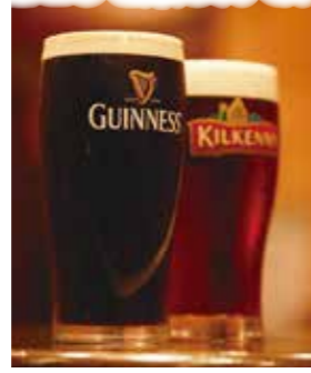
▲クリーミーな泡まで旨い!本場樽生ビール「ギネス」と「キルケニー」。1パイント各900円/1/2パイント各580円