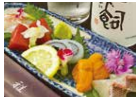
刺身の盛り合わせ(1,500円~) 雅ならではの新鮮な旬魚のお刺身。贅沢な味わいをぜひ。