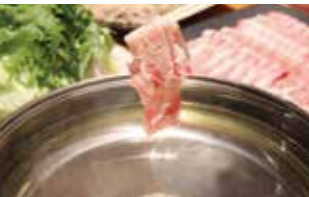
国産黒豚の豚しゃぶ鍋(二人前3,200円) 国産の黒豚と野菜を雅特製の和風だてで。メのそばも絶品。(※2名様より・要予約)