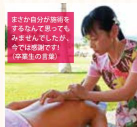
まさか自分が施術を するなんて思っても みませんでした。が、 今では感謝です! (卒業生の言葉)

ハワイ伝統マッサージ「ロミロ ミ」と、ハワイの花木や葉草から のアロマを組み合わせ、心も体も ゆったりほぐすボディケア。コリ、 むくみ、ストレスの解消、免疫力 アップ、美肌などが期待され人気 上昇中。スポーツ児童の体の痛み で悩まれているお母さんたちに も、また看護師や介護士などの技術アップや福利厚生としても好 評。今回のセミナーではハワイアンアロマの香りで癒されたり、自 分でできる「セルフロミロミ」を体験して頂きながら、本格的な施 術のデモンストレーションや、50時間で認定証を取得でき仕事が できるようになるレベルの講座(受講料月々1万円~)も紹介しま す。これまで20~70歳までの幅広い年代の受講生が認定証を 取得しました。自宅でも簡単に副業が可能。指や腰を痛めず、疲れ にくい方法を伝授。自分や家族の心身を守りたい、楽しく長く続け られる仕事の技術を学び たいという人も必見!