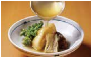
手間暇かけて丁寧に仕上げた贅沢な味わいに心もほっこり。

※旬の食材を使用するため、その日の仕入れによりお料理内容が変わることがあります。予めご了承ください。